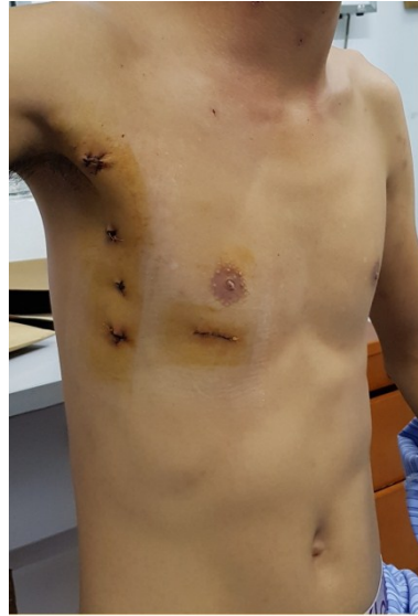
Hình 3. Sẹo mổ của BN trước khi ra viện.

Cannula TMC dưới được đặt sao cho đầu cannula nằm dưới van Eustachian 1-2cm để ngăn khí về TMC dưới. Phổi FX của hãng Terumo (CAPIOX FX Advance Oxygenator, Terumo, Bangkok, Thailand) được sử dụng để ngăn khí từ bình chứa vào đường động mạch.